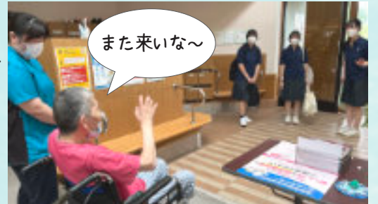
実習最終日の帰り、名残惜しくお見送り。