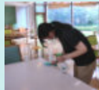
おそうじもぬかりなく