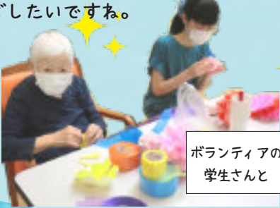
ボランティアの学生さんと

夏真っ盛り。連日の猛暑で夏バテの方も多くいらっしゃるのではないのでしょうか？ラ・フォーレではお祭りの飾り作り、リハビリがんばっております。暑さに負けず、元気に過ごしたいですね。