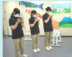
しっかりメモをとります