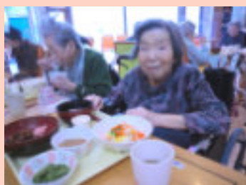
ちらし寿司きれいね～