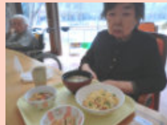
昼食。この日はカツ丼