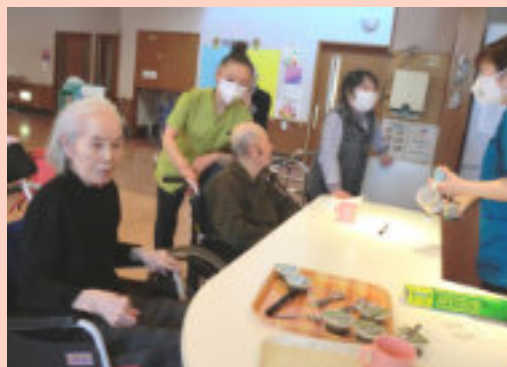
おやつ時間。カウンターに集まる皆さん