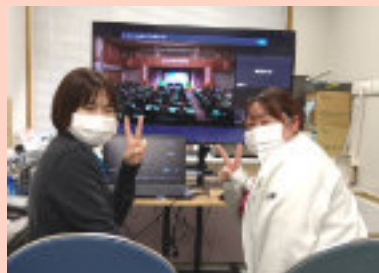
ラ・フォーレの一室にて発表

2月27日(木)、長井市で行われた老健大会にて研究発表を行いました。演題は『身体拘束の弊害について意識調査』。当職員を対象に身体拘束についてのアンケートを実施し考察したものです。