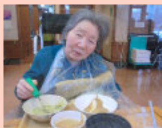
元気にしてますよ～