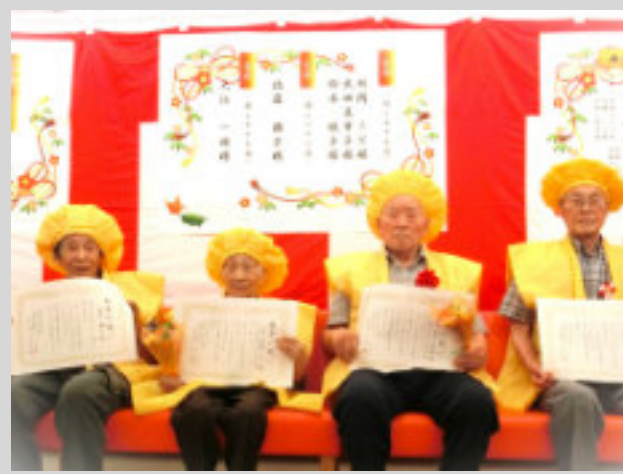
おめでとうございます!