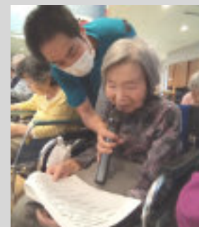
みなさん歌いましょう