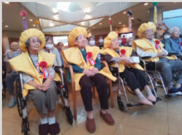
緊張の面持ち!!で待ちます