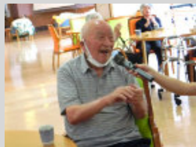
一言おねがいたします

敬老会 9月13日 (デイケア) 25日 (療養棟) 長寿、喜寿、米寿、白寿の方の表彰の他、デイケアではビンゴ大会、療養棟ではみんなで歌を歌うなどしてお祝いしました。