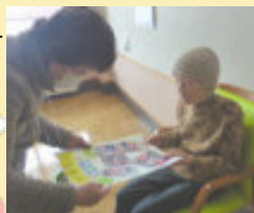
お部屋にて プレゼントを手渡し