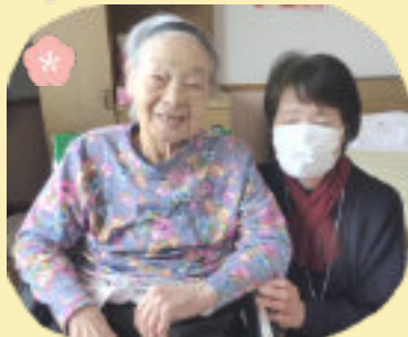
笑顔があふれました