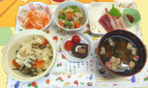
突然ですが 1月のお誕生会のランチ♪

おしながき 山菜ごはん 刺身 筑前煮 干し柿入りなます いちごとケーキ なめこのすまし汁