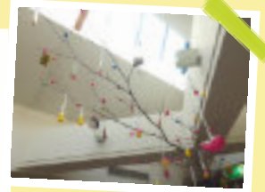
山口地区民生委員さまによる団子木飾り