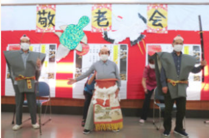
デイケア男性最高齢者の方の土俵入り～！

朝夕すっかり涼しくなり、虫の声とともに秋が深まってきました。虫の声に情緒を感じるのは日本人だけだとか。面白いですね。さてさて、9月16日（火）はデイケア、28日（水）には療養部で敬老会が行われました。最高齢者、白寿、米寿、喜寿の方の表彰と記念撮影の後、各部署趣向を凝らしたイベントが行われました。