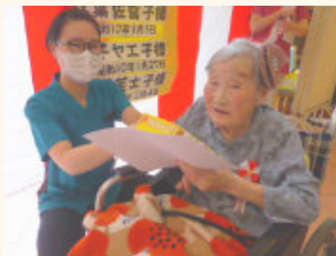
この日の為におめかししました