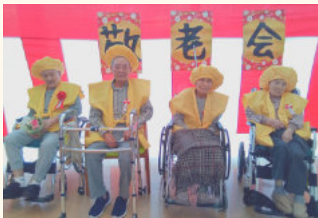
みなさん笑って～ハイチーズ！