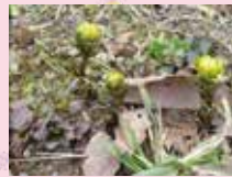
中庭の草木も少しずつ芽吹いてきました