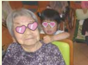
ないだっ、ありがとさま〜