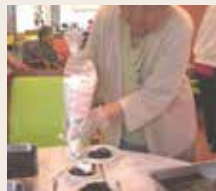
ホイップクリームをのせて〜