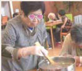
鍋を火にかけ、寒天を水に溶かす