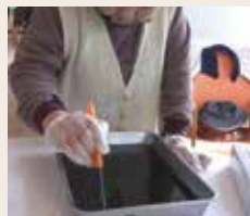
バットに流し冷やして固まったらカット