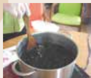
コーヒーと砂糖を入れて〜