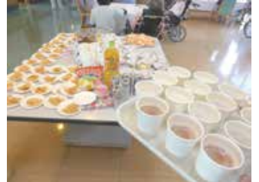
「花より団子」派の方々にも十分楽しんでいただけるようおつまみと飲み物各種も♪