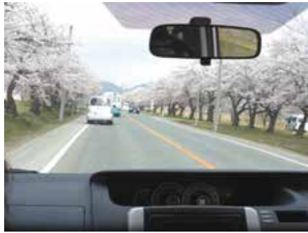
出発～！道中も桜を眺めながら…