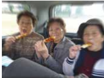
恒例の花よりだんごっ

デイケアでは4月19日～3日間天童市内、神町駐屯地とお花見に出かけました。初日は天気恵まれず車窓からの桜でしたが、次の日からは青空も見られるいいお天気。春爛漫、満開の桜にみなさんご満悦でした♪