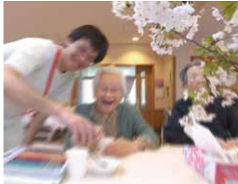
さあさ、ビールを一杯どうぞ

療養部は室内でまったりお花見。広場のテーブルに桜を屋内に持ち込んで。見事な満開の桜でした。特別感を味わっていただこうと、老健ではめったにお目にかかれないビール(ノンアルコール)もご用意。