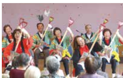
「浪花節だよ人生は」スコップ三味線

民謡や花笠踊り、タンバリンを使ったダンス、即興のハーモニカ演奏やら面白いトークやら、時間を忘れるあつという間の1時間でした。ありがとうございました。